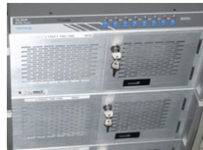
Datenhaltung auf leistungsfähigen Servern

Dieser Service garantiert höchste Sicherheit für Ihre wertvollen Daten.